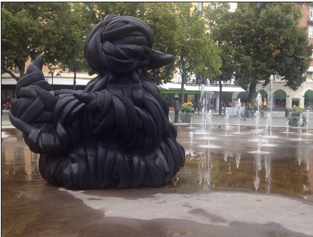
En badanka gjord av bildäck i Örebro centrum. Konstnär Villu Jaanisuu

anneli@kulturochkvalitet.se mobiltelefon 0709 36 08 37